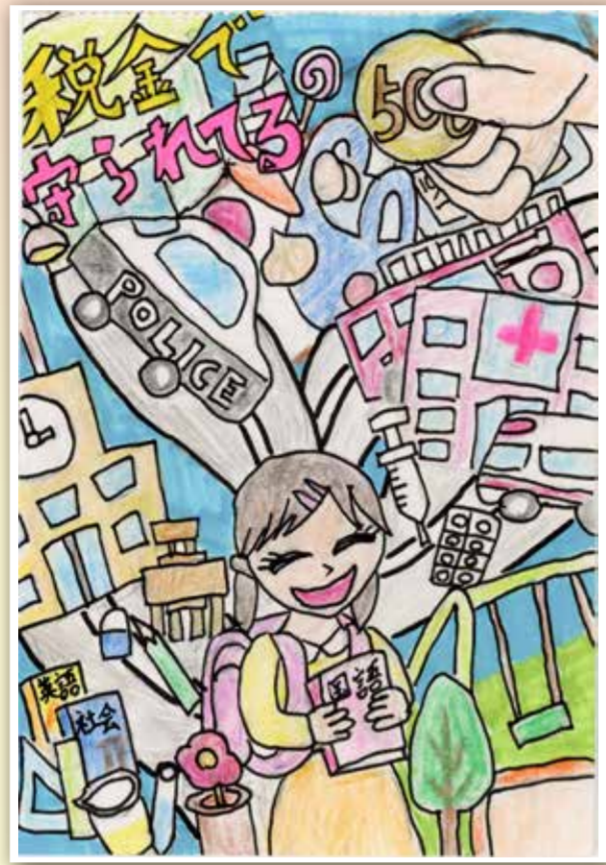
金武 銀杏 (あげな小学校)